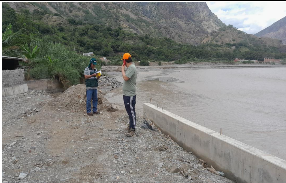
FOTOGRAFIA N° 01: SE OBSERVA LA MARGEN DERECHA DEL RIO MARAÑÓN QUE REQUIERE DE UNA ESTRUCTURA PERMANENTE DE PROTECCION PARA MITIGAR POSIBLES INUNDACIONES EN EL SECTOR VIJUS