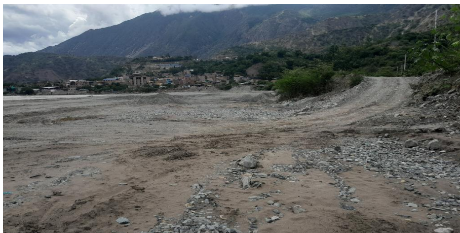
FOTOGRAFIA N° 02: SE OBSERVA LA MARGEN DERECHA DEL RIO MARAÑON QUE HA SIDO EROSIONADO POR ANTERIORES AVENIDAS LAS MISMAS QUE QUE LA POBLACION ESTA EN RIESGO