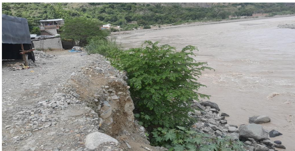
FOTOGRAFIA N° 03: SE OBSERVA LA EROSION EN LA MARGEN DERECHA DEL RIO MARAÑON QUE REQUIERE UNA PROPUESTA DE DIQUE CON ENROCADO Y ESPIGONES PARA DESVIAR EL CAUCE DE LA POBLACION DEL SECTOR VIJUS